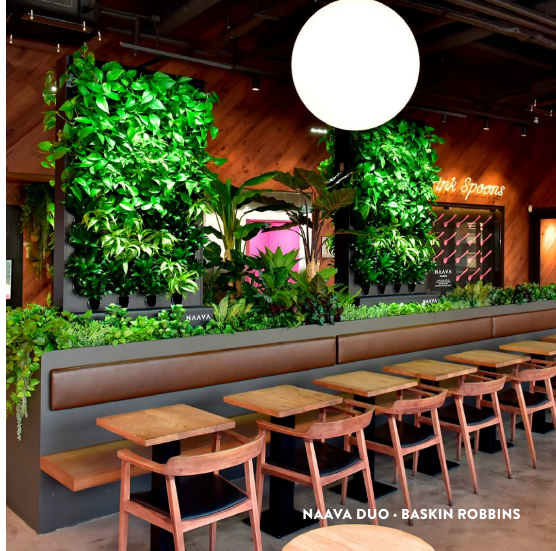
NAAYA DUO · BASKIN ROBBINS