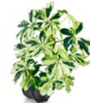
KLEINE STRAHLENARALIE 'CHARLOTTE' - SCHEFFLERA ARBORICOLA 'CHARLOTTE'