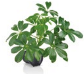
KLEINE STRAHLENARALIE - SCHEFFLERA ARBORICOLA 'NORA'