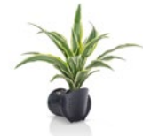
DRACHENBAUM 'SURPRISE' - DRACAENA DEREMENSIS 'SURPRISE'