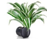
DRACHENBAUM 'WHITE JEWEL' - DRACAENA DEREMENSIS 'WHITE JEWEL'